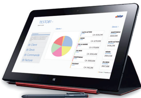
EBP GesCom Mobile : Consultez le prix d'un article et sa disponibilité en stock et chiffrez immédiatement votre prestation.

Accédez à vos données partout, tout le temps grâce à notre application GesCom Mobile (1) pour tablette (disponible sur Windows, Android). L'accès et les interactions se font à distance. Vous prolongez l'utilisation de votre solution de gestion commerciale sur le terrain et gagnez ainsi en productivité.